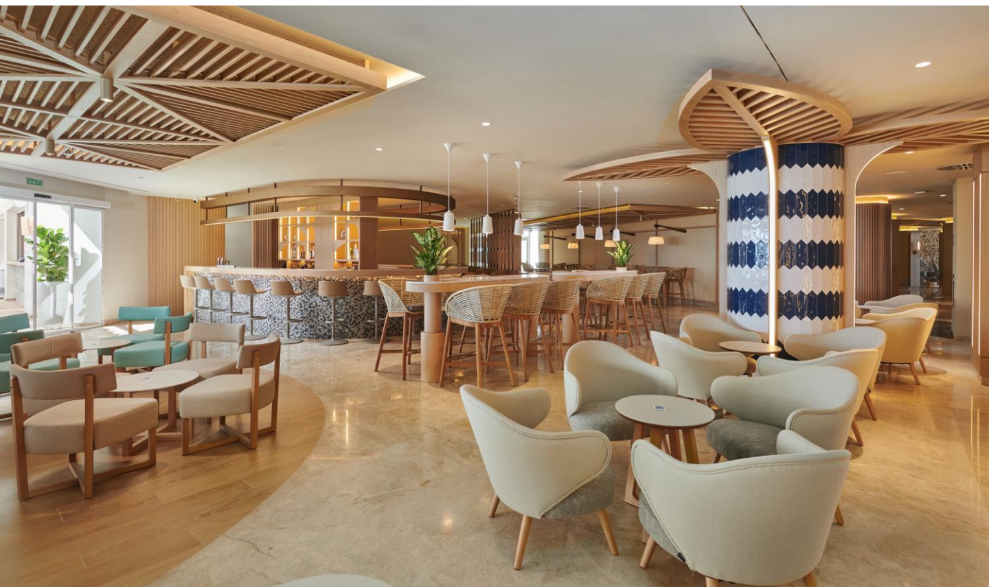
Lobby Bar del Hipotels Flamenco 4*

Palma de Mallorca, junio de 2024.- Inaugurado en 1975 y en manos de Hipotels desde 1995, cuando se acometió la última actualización, el hotel Flamenco de Cala Millor (Mallorca) se inaugura tras unos meses de reforma convertido en el buque insignia de la sostenibilidad de la cadena. El nuevo Hipotels Flamenco marca un antes y un después en las políticas de eficiencia de la compañía.