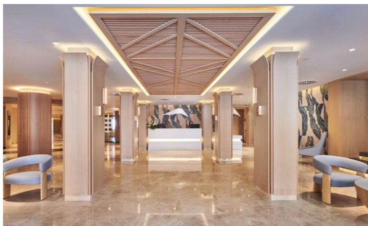
Nuevas habitaciones y hall principal de entrada

Respecto al diseño, las nuevas instalaciones tienen un aire más moderno, basado en los tonos mediterráneos y siguiendo los colores de la marca: azules, ocre y blancos, con detalles decorativos que remiten a la naturaleza de la zona. El mobiliario, de líneas puras, responde a una estética cálida y cómoda, que invita a relajarse y disfrutar de las instalaciones, en línea con el “lujo tranquilo” que promueve la firma, y que se basa en un trato exquisito y unas instalaciones de gran confort.